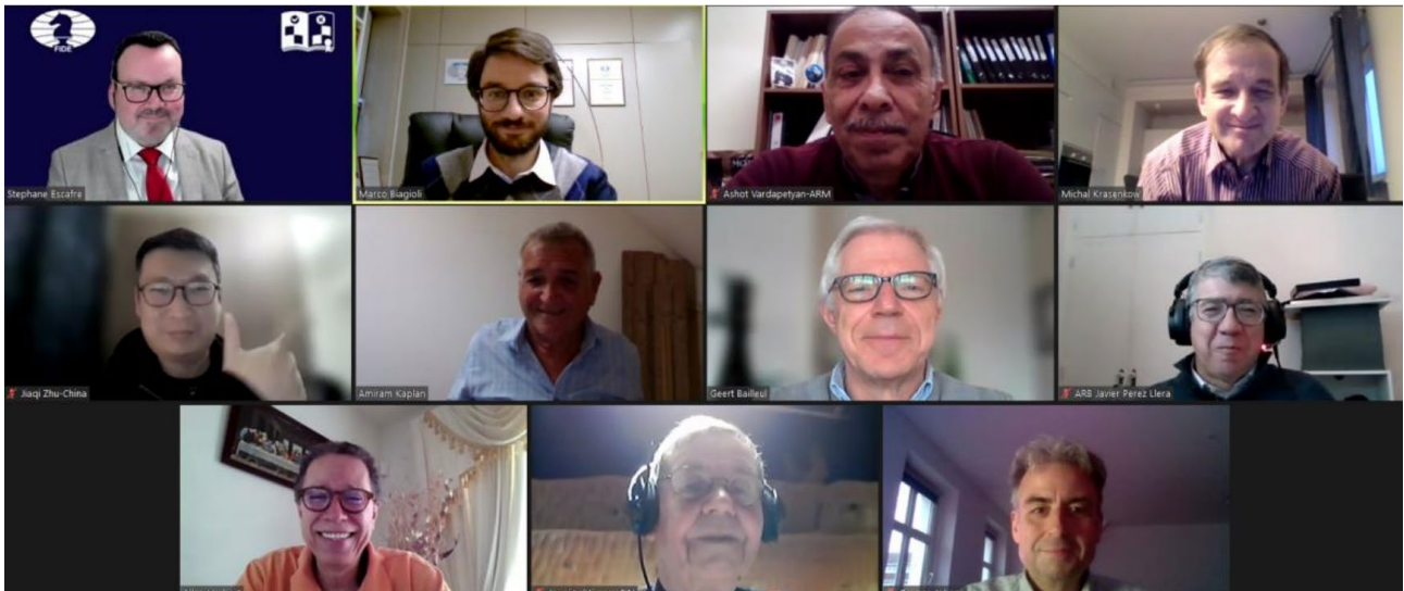
Videokonferenz der neuen FIDE-Regelkommission