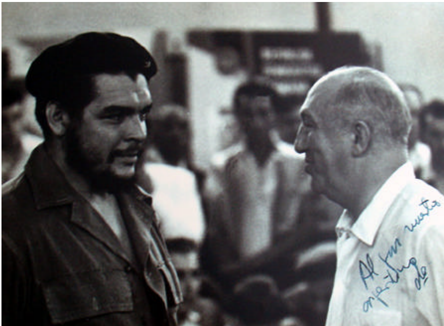
Begegnung mit Miguel Najdorf

Es gelang ihm zusammen mit Fidel Castro, die damals weltbekanntesten Spieler nach Kuba zu Turnieren und Simultanvorstellungen einzuladen wie: Bobby Fischer, Michael Tal, Tigran Petrosjan und Miguel Najdorf; nur um einige zu nennen.