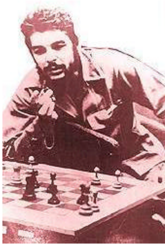
Che Guevara

Es gelang ihm zusammen mit Fidel Castro, die damals weltbekanntesten Spieler nach Kuba zu Turnieren und Simultanvorstellungen einzuladen wie: Bobby Fischer, Michael Tal, Tigran Petrosjan und Miguel Najdorf; nur um einige zu nennen.